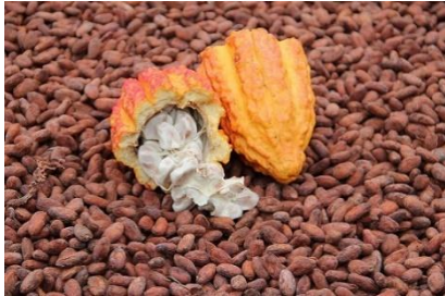
Bild 2: Kakaobohnen.

Auf diesem Bild siehst du eine Kakaofrucht. In ihrem Inneren wachsen die Kakaobohnen . Diese sind bei der Ernte weiß. Beim Verarbeiten färben sich die Kakaobohnen braun.