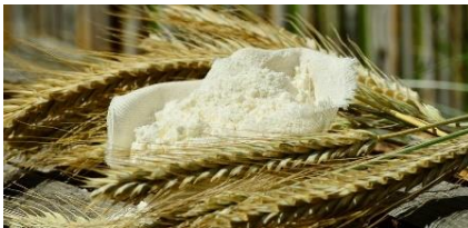
Bild 1: Mehl (gemahlen).

etwas mahlen : etwas ganz klein machen, etwas zerreiben; Um Mehl zu machen, wird Getreide gemahlen . Das passiert in einer Mühle.