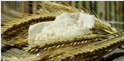
Bild 2: Mehl ( gemahlen).

Um Mehl zu machen, wird Getreide gemahlen . Das passiert in einer Mühle.