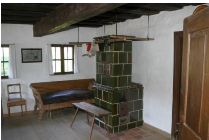
Bild 8: Kachelofen.

Ein Kachelofen ist ein Ofen im Haus. Außen sind Kacheln . Die Kacheln sehen aus wie Fliesen. Die Menschen heizen einen Kachelofen meistens mit Holz. So wird es im Haus schön warm. Auch heute haben manche Menschen noch einen Kachelofen zuhause.