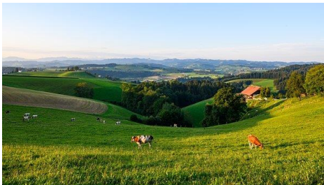
Bild 7: Hügelland.

Ein Hügel ist ein kleiner Berg. In einem Hügelland gibt es viele dieser Hügel .