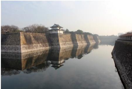
Bild 3: Burggraben.

Ein Burggraben ist eine Grube rund um die Burg. Der Burggraben schützt die Burg vor Feindinnen und Feinden. Um die Riegersburg herum gibt es zwei Burggräben . Auf dem Foto siehst du einen Burggraben .