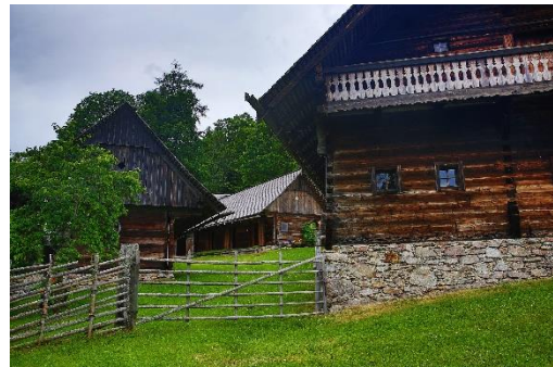
Bild 7: Peter Roseggers Geburtshaus am Kluppeneggerhof.

Der Kluppeneggerhof ist heute ein Museum, das du nur zu Fuß erreichen kannst. Die Wanderung dorthin ist aber kurz und dauert nur ungefähr 30 Minuten. Von Weitem kannst du schon das Wohnhaus mit den Ställen und der Scheune sehen. In den Ställen war für mehr als 50 Tiere Platz. Bei dem alten Bergbauernhaus kannst du vieles über das Leben der Menschen früher erfahren. Dort siehst du alte Werkzeuge, Möbel und Alltagsgegenstände . Wenn du mehr über das Leben von Peter Rosegger erfahren möchtest, kannst du in Krieglach eine Lesewanderung machen.