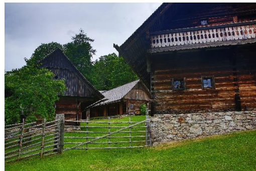
Bild 7: Peter Roseggers Geburtshaus am Kluppeneggerhof.

Heute ist der Kluppeneggerhof ein Museum. In ungefähr 30 Minuten kannst du dorthin wandern. Dort siehst du auch Ställe und eine Scheune . Früher lebten in den Ställen mehr als 50 Tiere. Beim Kluppeneggerhof gibt es auch viele alte Werkzeuge, Möbel und Alltagsgegenstände . Wenn du mehr über Peter Rosegger erfahren möchtest, kannst du eine Lesewanderung machen.