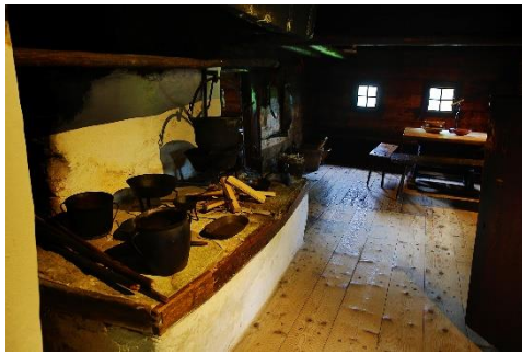
Bild 6: Stube in Peter Roseggers Geburtshaus.

Im Bergbauernhaus kochten die Menschen über einer Feuerstelle . Diese hieß „Rauchkuchl“. Das ist das steirische Wort für Rauchküche . Es gab nur einen großen Raum, in dem die Menschen wohnten.