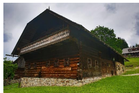
Bild 5: Peter Roseggers Geburtshaus.

Der Kluppeneggerhof ist ein Bergbauernhaus aus dem 18. Jahrhundert. In diesem Haus ist Peter Rosegger aufgewachsen. Damals wohnten die Menschen ganz anders als heute.