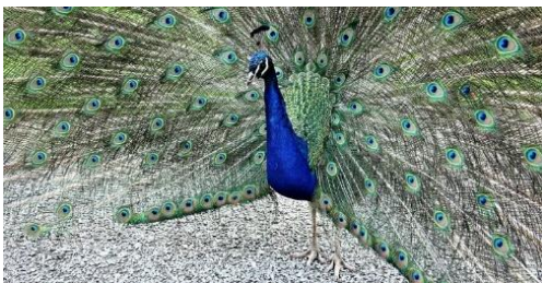
Bild 10: Pfau.

Der Pfau ist ein Vogel. Er ist blau und hat lange, bunte Federn. Auf dem Bild siehst du einen Pfau.