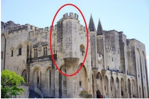
Bild 3: Eckturm.

Türme sind manchmal an den Ecken eines Schlosses. Dann heißen sie Ecktürme . Auf dem Bild siehst du einen Eckturm .