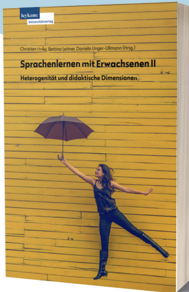
Christian HOFER, Bettina LEITNER, Daniela UNGER-ULLMANN (Hrsg.) Sprachenlernen mit Erwachsenen II. Heterogenität und didaktische Dimensionen