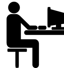
Digitale Inputs des Schreibzentrums