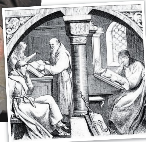
In Schreibstuben, so genannten Skriptorien, verfassten Mönche im Mittelalter geistliche Texte.