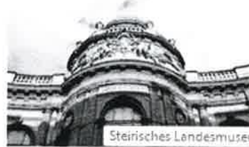
Steirisches Landesmuseum Joanneum in Graz

1811 von Erzherzog Johann gegründet, entwickelte sich das Joanneum von einer kompakten Lehrsammlung zu einem der bedeutendsten Museen Europas. Mehr als 4,5 Millionen Sammlungsobjekte werden heute an 13 Standorten in der ganzen Steiermark gesammelt, bewahrt, erforscht und umfassend vermittelt.