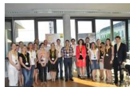
Die 16 geladenen Expert/innen