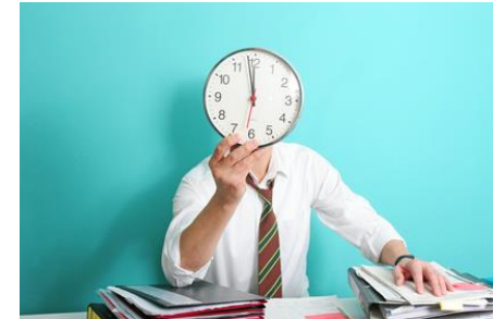
Überstunden ohne Ende? Die Plattform kununu gibt Einblick in die Gepflogenheiten von Unternehmen

Es ist jedoch Vorsicht geboten, denn auf Plattformen wie diesen laden manche MitarbeiterInnen oder Ex-MitarbeiterInnen Ihren Unmut über den eigenen Arbeitgeber ab. Zudem ergibt sich teils wenig Aussagekraft aufgrund von einer geringen Anzahl an Bewertungen.