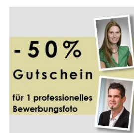
Details zur Uni Foto Aktion finden Sie hier >>>

Hier finden Sie nähere Infos sowie das Beitrittsformular >>>