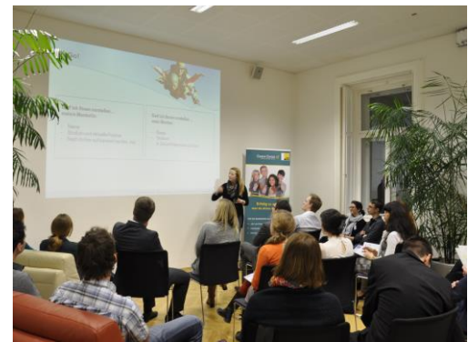
Gespannt erfahren die TeilnehmerInnen alle Details zum Mentoring-Programm 2014.