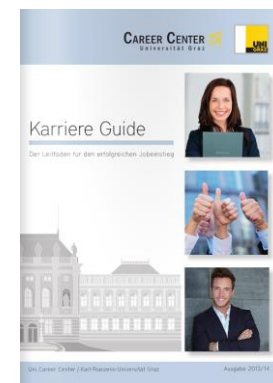
Mehr zu Initiativbewerbungen finden Sie in unserem Karriere Guide 2013/14 .

Ergreifen Sie nun die Initiative und bewerben Sie sich bei Ihrem Wunscharbeitgeber!