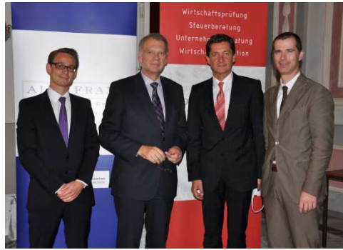
Experten-Runde des High Potentials Afternoons 2011

Einen umfangreichen Fotorückblick zur Veranstaltung finden Sie >>>hier .