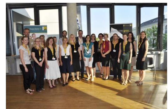
ExpertInnen der Berufsbranchen

Alle Bilder der Expedition Zukunft 2013 finden Sie hier .