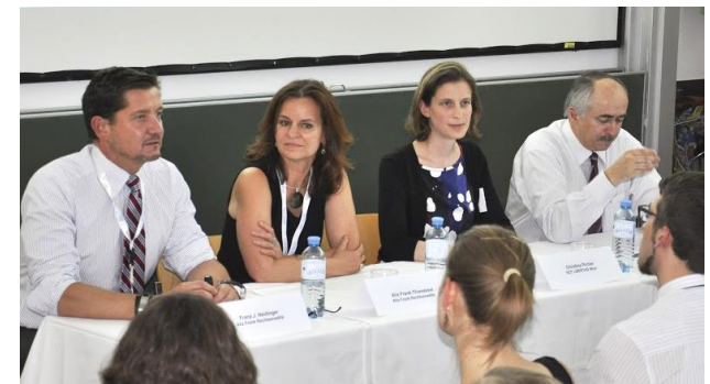
Am Podium zu Gast (v. links n. rechts):

Alix Frank Rechtsanwälte GmbH >>> SOT Süd-Ost Treuhand >>>