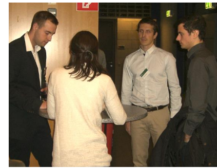
TeilnehmerInnen nach dem Case beim gemeinsamen Austausch

Ein abschließendes Buffet sorgte zudem für vertiefende Gespräche und das Ausloten der Karriere-Möglichkeiten bei BCG.