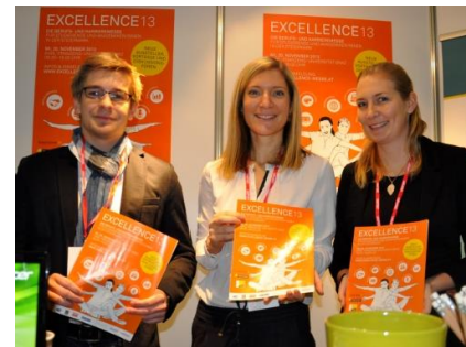
Das Team des Uni Career Centers am Messetand

Einen Einblick in Bildern finden Sie hier >>>